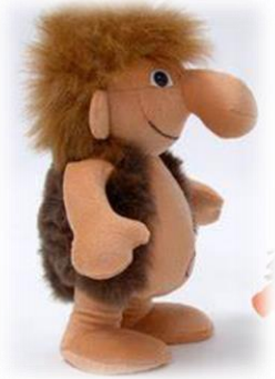
«Tränchen» auch «Big Foot» genannt, unser Trauerheld